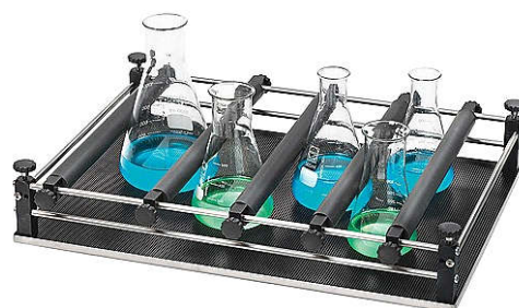
Zestaw Combifix SM 30 560x400 mm