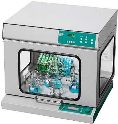
Nadstawka inkubatorowa TH 30