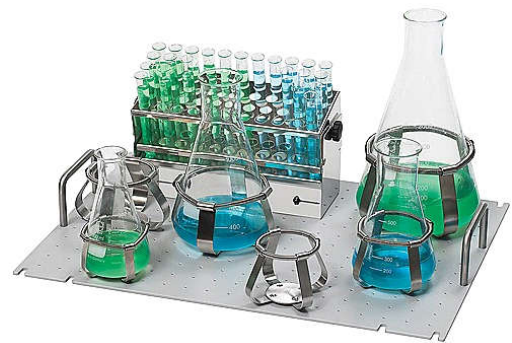
Uniwersalna taca do montażu uchwytów do SM 30 560x400 mm