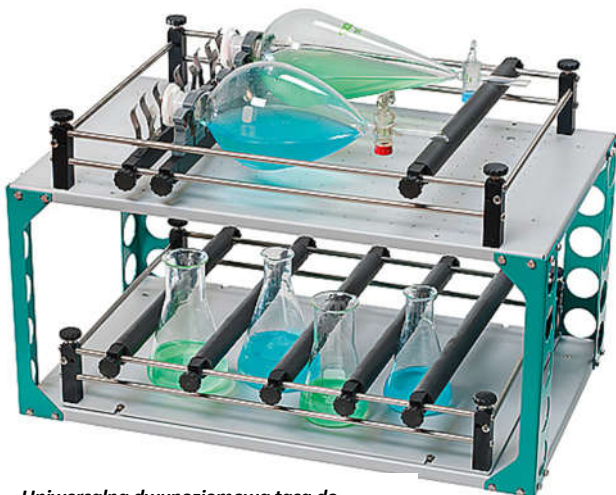
Uniwersalna dwupoziomowa taca do montażu uchwytów do SM30 560x400 mm